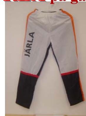
14. Tävlingsbyxa (Nylon långa) 70:- Storlek: 130-XXL OBS! Ingår ej längre i tävlingsdräkten -REAS ut