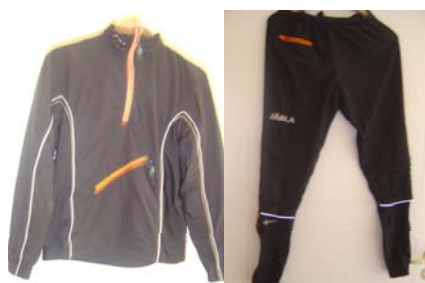
13. NoName overall 860:- Storlek: 150-XL