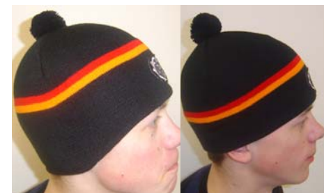
6. Mössor (Öronlapp/Rak) 70:- Storlek: One size