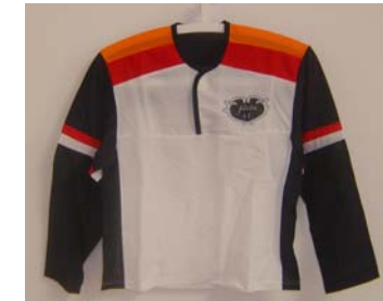
2. Tävlingsströja (Nylon lång ärm) 240:- Storlek: 140-XXL