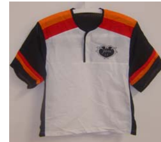
1. Tävlingsströja (Nylon kort ärm) 240:- Storlek: 130-XXL