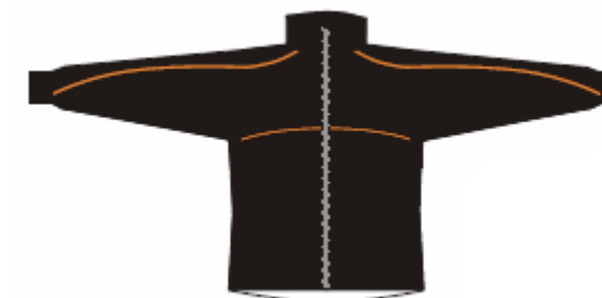
Träningsjacka (Trimtex) XXX:- Storlek: 150-XL