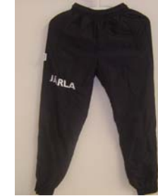
8. Kämpéla Överdrag (Byxa) 315:- Storlek: 130-XXL