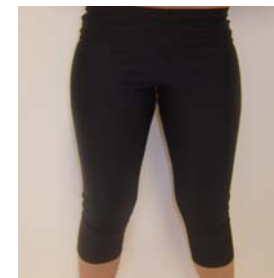
3. Tävlingsbyxa (Tights-knä) 200:- Storlek: L-XL