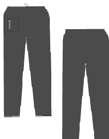
11. Tävlingsbyxa (Nylon-Lång) 240:- Storlek: 150-XL