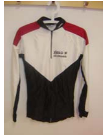
16. Skiddress (Tröja) 400:- Storlek: XXS-XXL