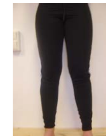
4. Tävlingsbyxa (Tights långa) 200:- Storlek: 140-XXL