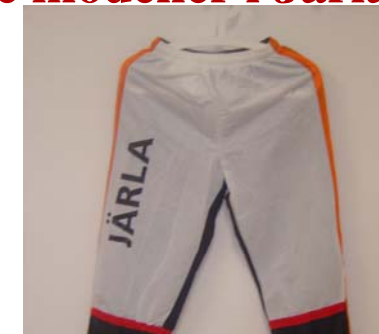
15. Tävlingsbyxa (Nylon korta) 70:- Storlek: M, L OBS! Ingår ej längre i tävlingsdräkten -REAS ut