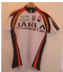
9. Tävlingsströja (Combat) ~400:- Storlek: 150-XL