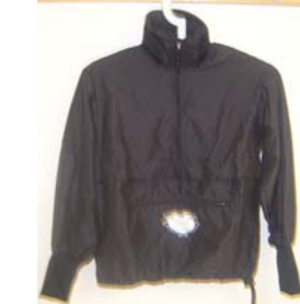
7. Kämpéla Överdrag (Jacka) 315:- Storlek: 130-XXL