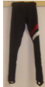
17. Skiddress (Tights) 200:- Storlek: XXS, XXL