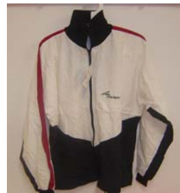
18. Skidöverdrag (Jacka) 650:- Storlek: S, M