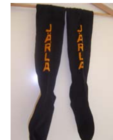
5. Tävlingsstrumpor 60:- Storlek: 35-37, 38-40, 41-43, 44-46